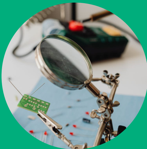
Características, equipos, comunicaciones y protocolos en entornos industriales

Como consecuencia de este trabajo, los socios han creado dos guías didácticas que sirven como base para la continuación del proyecto y futuros resultados dentro del mismo